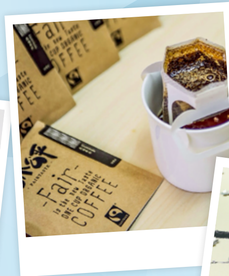
◀▼逾二百間社企參與「伙伴倡自強」計劃，提供的服務及產品多元化，例如提供公平貿易食品的「公平棧有限公司」、把鋁罐升級再造的社企 Alchemist Creations Co. Ltd.。