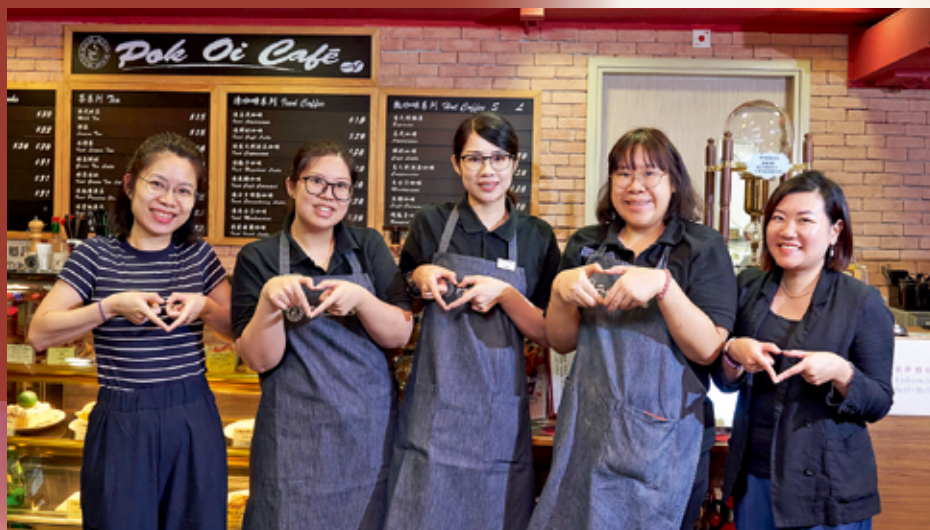
▲君君(中)與同事融洽相處，增加了溝通能力及自信心。