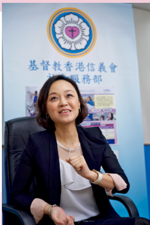
▲黃翠恩女士表示，「外出易」人手相對充足，能提供市場上有適切需要的服務。